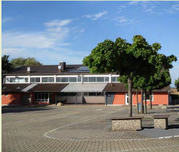
Startpunkt: Turn- und Festhalle